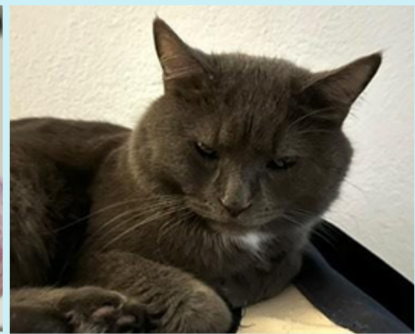
Katze mit deutlichen Schmerzzeichen: Ohren zur Seite geklappt, Augen stark zugekniffen, Gesicht hochgradig angespannt, Kopfniveau tiefer