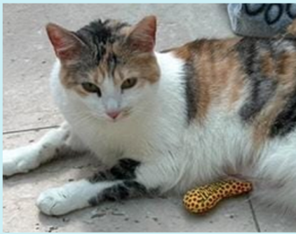
Katze mit leichten Schmerzzeichen: Ohren leicht zur Seite, Augen leicht zugekniffen, Gesicht leicht angespannt, Kopfniveau tiefer