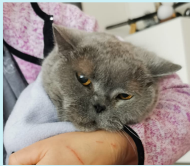
Katze mit deutlichen Schmerzzeichen: Ohren zur Seite und nach hinten, Augen zugekniffen, Gesicht angespannt, geduckte Haltung